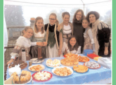
Za výtěžek z prodeje vlastního pečiva na šalmaji skautky adoptovaly jednu varhanní píšťalu.