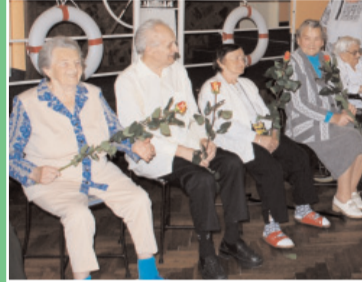
Domov důchodců na Březových Horách je v provozu již 10 let. Oslava byla opravdu příjemná.